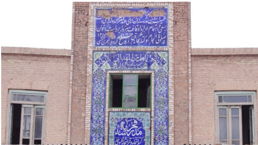
■ مدرسه فخریه

که در قرن ۵ هجری و در دوره سلجوقیان تأسیس گردیده، بیشتر است. نام این مدرسه از نام فخرالدوله دیلمی یکی از حاکمان شیعه مذهب دیلمی است، گرفته شده و اینک از بنای قدیمی و اصلی این مدرسه، دو حجره و یک راهرو، دست نخورده باقی مانده است.