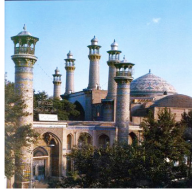
■ مدرسه سپهسالار