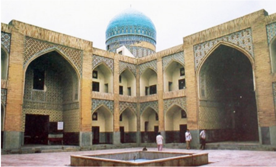
■ مدرسه غیاثیه

در سال ۸۹۶ هجری قمری به دستور خواجه غیاث‌الدین پیر احمد خافی؛ وزیر سلطان شاهرخ بهادر تیموری بنا شد و به همین دلیل به «غیاثیه» مشهور گردید. این بنا نماینده کامل معماری دوره تیموریان است؛ که به سبک آذری ساخته شده است. معمار این مدرسه استاد قوام‌الدین شیرازی بود؛ که در حال کار روی بنا فوت کرد و کار نیمه تمام وی را برادرش غیاث‌الدین شیرازی که مجموعه گوهرشاد و هرات را نیز ساخته، کامل کرد. مدرسه غیاثیه در دوران شکوهش از بهترین دانشگاه‌های اسلامی بوده است.