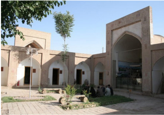
■ مدرسه دودر