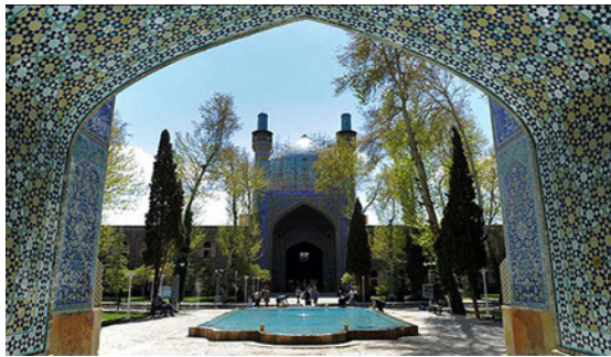
■ مدرسه چهارباغ

مدرسه چهارباغ اصفهان که مدرسه سلطانی و مدرسه مادر شاه نیز خوانده می‌شود، توسط آخرین شاه سلسله صفویه یعنی شاه سلطان حسین ساخته شد و چون مادر شاه املاک و مستغلات فراوانی را وقف آن کرد، به مدرسه مادر شاه معروف شد. حتی خود شاه سلطان حسین نیز در این مدرسه به تحصیل علوم دینی اشتغال داشت و اکنون حجره‌ای را در مدرسه نشان می‌دهند؛ که گفته می‌شود، حجره مخصوص او بوده است. این مدرسه را باید آخرین درخشش معماری عصر صفوی و یکی از شاهکارهای معماری ایران طی ۴۰۰ سال گذشته به شمار آورد. مدرسه چهارباغ به شیوه مساجد بزرگ ایرانی به شکل چهار ایوانی ساخته شده و علاوه بر صحن بزرگ، یک گنبد بلند و دو مناره در دو سوی ایوان قبله دارد. تزیینات به کار رفته در این مدرسه خصوصاً کاشی کاری‌های آن بسیار نفیس هستند و آن را به یک موزه تمام عیار مبدل کرده‌اند (محمدعلی موسوی فریدنی، ۱۳۷۸).