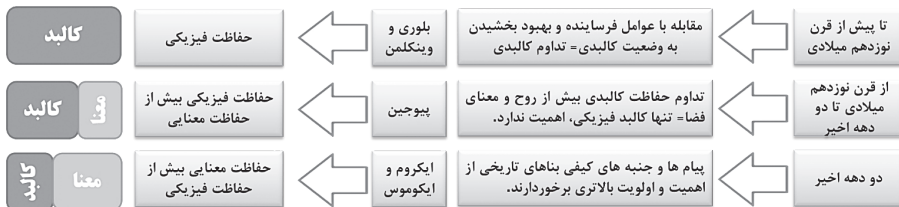
تصویر ۱-۳- دیدگاه حفاظت معماری در طول زمان، (مأخذ: نگارندگان)

در مجموع حفاظت را دست‌کم به دو معنا می‌توانیم بشناسیم (تصویر: ۱-۳). حفاظت به معنای عمل (حفاظت کالبدی) و حفاظت به معنای نظر (حفاظت معنایی). حفاظت به معنای عمل، که در جایگاه «حرفه و دانش حفاظت» قرار می‌گیرد، مجموعه اقداماتی است که تکیه بر عمل دارد؛ چه عمل مستقیم که منجر به دست بردن در کالبد و ماده اثر می‌شود، چه عمل نامستقیم که با دست بردن در پیرامون اثر یا تغییر مسیر اتفاقاتی می‌شود که اثر از آن‌ها متأثر است. حفاظت به معنای نظر، از جنس چرایی و چیستی و در قلمرو معرفت‌شناسی قابل بسط است و به مفاهیم، نظریه‌ها، معانی و چندوچون حفاظت می‌پردازد (ابویی و نیکزاد، ۱۳۹۶، ۱۷۱).