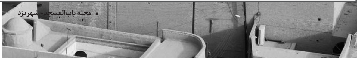
■ محلہ باب المسجد - شہر یزد